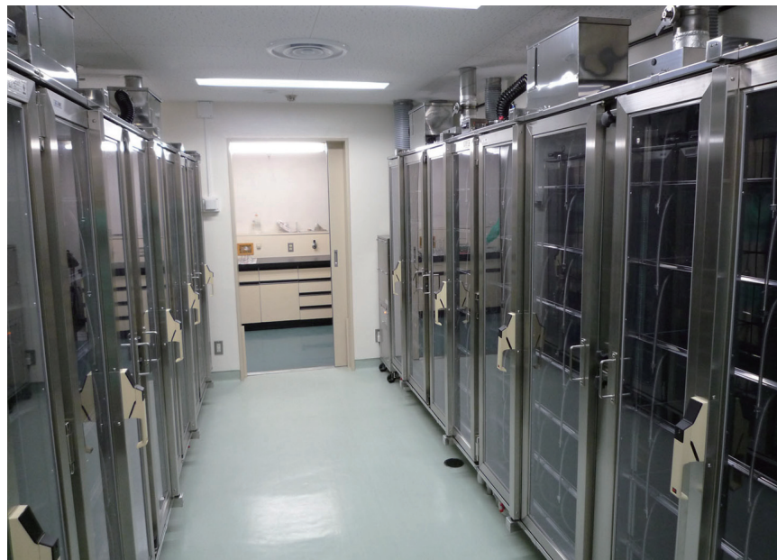
左写真 一方向気流式ラック設置後のマウス飼育室 (417室 平成22年改修)

動物資源部門鹿田施設では、利用者の皆様からマウス飼育スペースの拡充のご要望を多数頂き、随時飼育室の整備を行って参りましたが、施設繰越金が底を尽き、独自の整備が十分に実施できない状況でした。この度、設備整備マスタープランに基づいて、4階、三室（二室改修、一室増設）に一方向気流式飼育ラックを設置する予算措置がなされました。供用開始は平成25年初頭を予定して準備を進めています。今しばらくお待ちください。