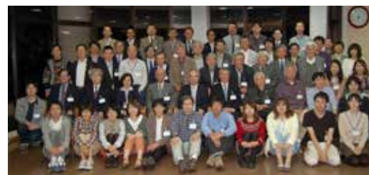
理学部同窓会：平成25年理学部同窓会