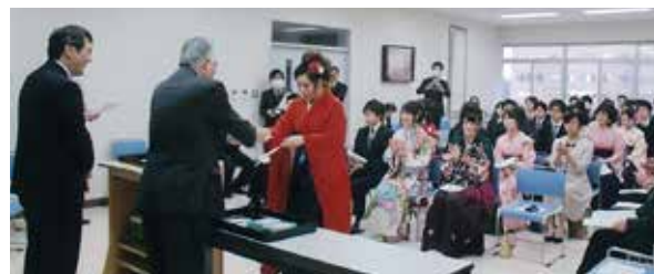
教育学部同窓会：平成25年度学業優秀表彰式