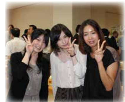
ほおゆう：同窓会懇親会