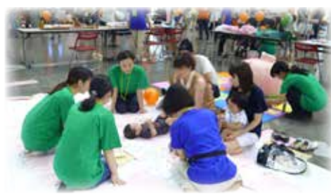
助産師同窓会：同窓生と一緒に子育て支援活動