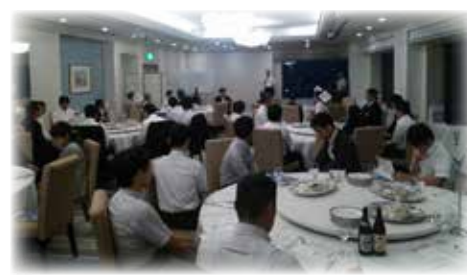
法文経学部同窓会：平成26年度広島支部総会

(参考) (a)会費納入者が会員、(b)入学者・在学者が会員、(c)在学中は賛助会員又は学生会員 (ア)終身会費、(イ)年会費、(ウ)入会金、(工)その他