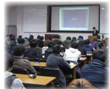
工学部同窓会：卒業生による企業活動講演会