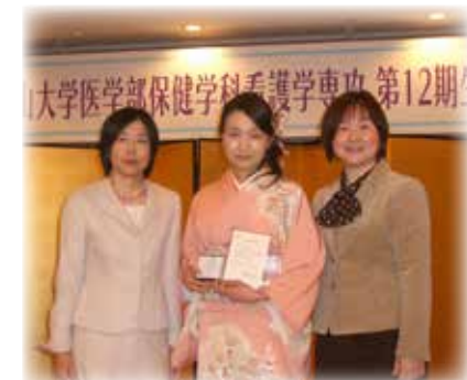
ときわ会：謝恩会での「ときわ会賞」の授与