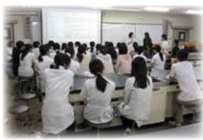
歯学部同窓会：6年生対象女性歯科医師セミナー