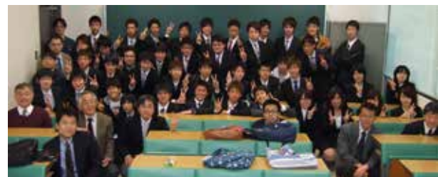
環境物質工学部同窓会：平成26年度新入生歓迎