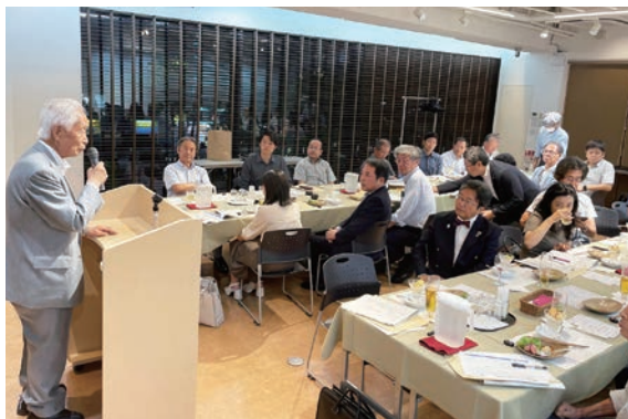
東京支部懇談会の様子

学部の垣根を超えた交流と親睦を図ることを目指して、支部活動の活性化に資する企画を支援しています。各支部の活動をご紹介します。