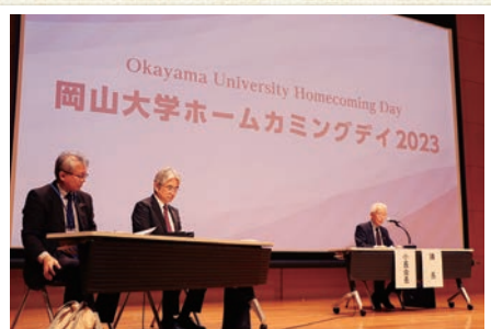
第11回岡山大学Alumni(全学同窓会)総会

創立五十周年記念館の周辺には、大学にゆかりのある方々による出店テント、キッチンカーが並び、多くの来場者でにぎわっていました。その他、共有共創コモンズ一般開放、各学部や図書館・文明動態研究所・卒業生による企画や在学生によるミュージックフェスティバルなど多彩な催しが実施され、在学生と同窓生をはじめとする多くの交流が活発に行われました。また、特設サイトを開設し、オンライン企画や当日の様子等の映像配信など、遠方の方にも楽しんでいただけるよう新しい取り組みも実施しました。来年度以降もより多くの皆様と繋がる機会となるイベント目指していきますので、楽しみにしてください。