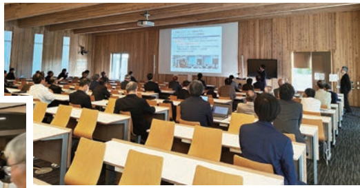
工学部同窓会 報告会