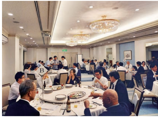
法文経学部同窓会 広島支部総会風景