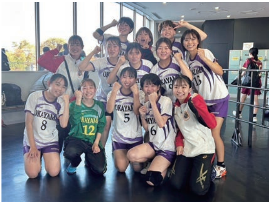
女子ハンドボール