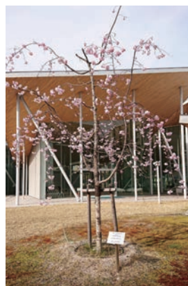
鹿田キャンパス Jホール前 記念植樹の枝垂桜