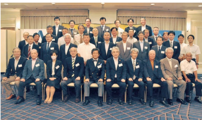
広島支部総会集合写真