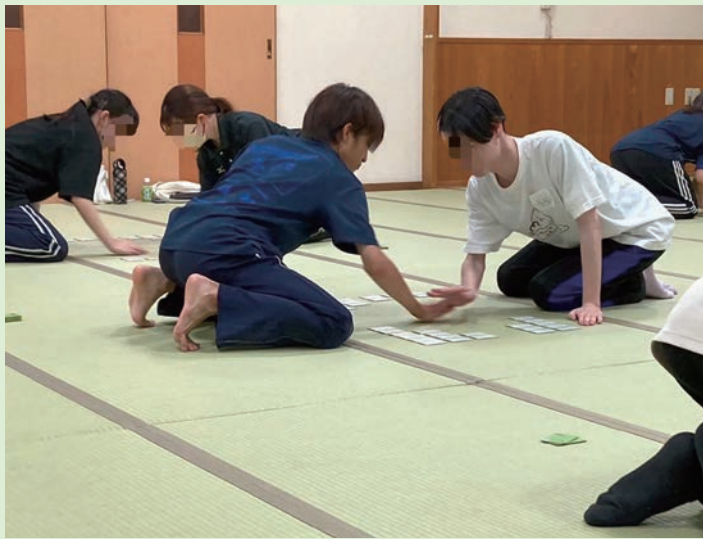
試合中の写真は合宿でOBと試合をしている様子

私が競技かるたと出会ったのは高校一年生の春、部活動見学で部内の雰囲気良さに惹かれて始めることになりました。すっかりかるたに魅了された私は、高校生の時から大学でも続けたいと思うようになります。 岡山大学のかるた部には高校時代の知人が所属していたため、入学前から練習に参加させて頂きました。先輩方の温かい雰囲気の中で、沢山のアドバイスを頂けることは自分の成長に大きく繋がっていると実感しています。自分よりも遥かに強い先輩方に指導して頂くことで、技術面や考え方など数多くの事を吸収できたように思います。自分の実力が向上していることを日々実感し、かるたを心の底