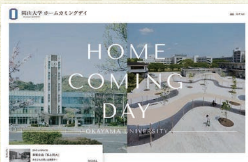
ホームカミングデイ特設サイト