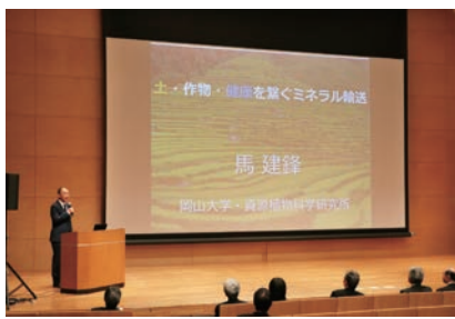
金光功労賞受賞記念講演