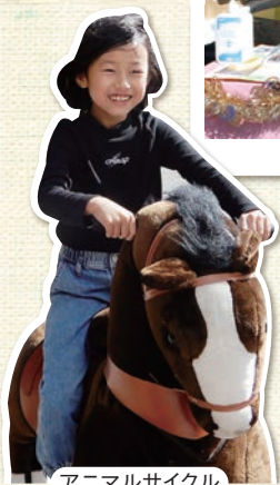
アニマルサイクル