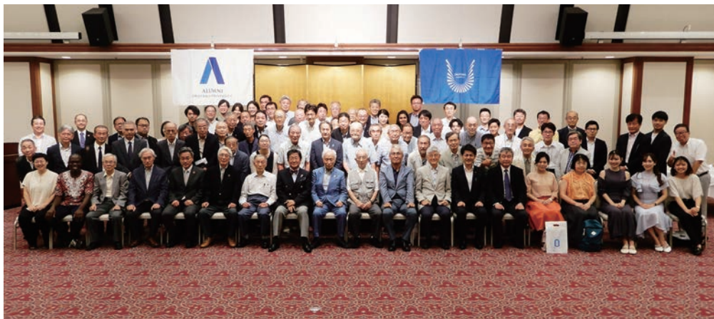
東京支部総会集合写真