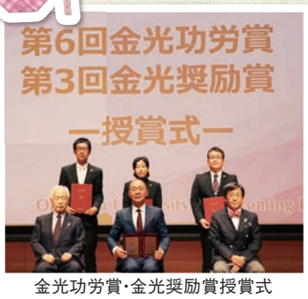
金光功労賞・金光奨励賞授賞式