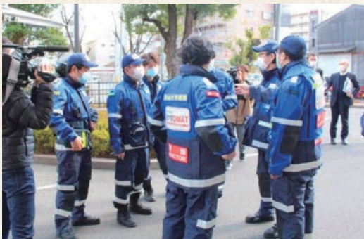
出発前に最終確認するDMATチーム

情報工学先進コースの募集人員40人は工学部工学科の増員分30人に化学・生命系の募集人員目安からの減員分10人を加えたものです