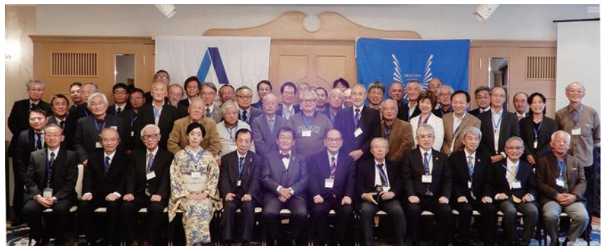
関西支部総会集合写真

Alumni 関西支部同窓会を学部別に見ると、工学部18名、法文経学部14名、理学部4名、歯学部4名、農学部3名、医学部2名と学部間でかなりのばらつきがあります。また、教育学部、薬学部、看護専門学校卒業生の参加はありませんでした。出席者は学部卒業生の数や卒業後の職業にもよるので、参加人数が学部ごとに異なるのは仕方がないにしても、「全学同窓会」と銘打つ以上、どの学部も最低数名程度の参