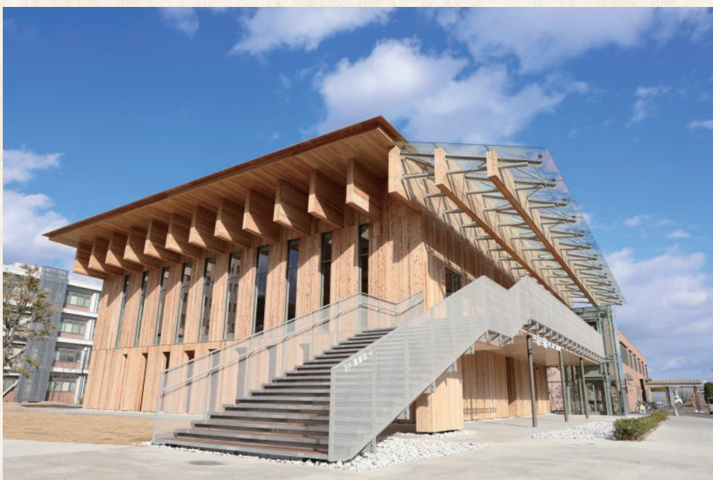
共育共創コモンズの外観