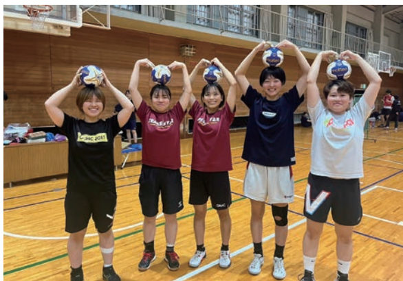
女子ハンドボール