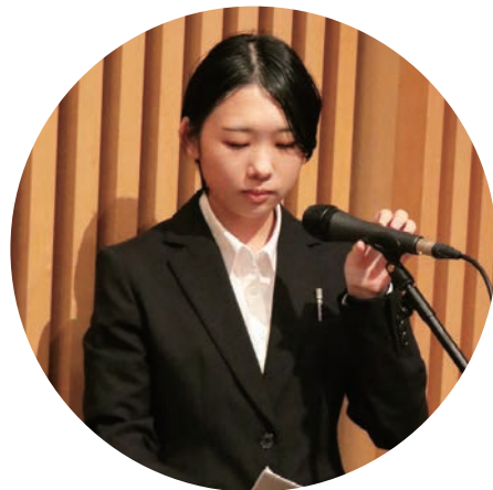
ホームカミングデイ司会の様子

配る必要があるのですが、行き詰まることが多々あります。しかし取材・撮影に快く協力してくださる皆様や相談に乗ってくれる部員がいたからこそ壁を乗り越え、満足いく作品をつくることができ、昨年度の大賞では映像番組部門で第1位、今年度も同部門で第2位と好成績を収めることができました。 さらに私たちは依頼を受けて司会業務や動画撮影・編集を行っています。今年度は入学式や学位記等授与式、ホームカミングデイなど大学行事、学内団体の定期演奏会や、中四国国立大学合同演奏会・美術展覧会など多くの業務を担当させて頂きま