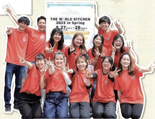
The World Kitchen実行委員会