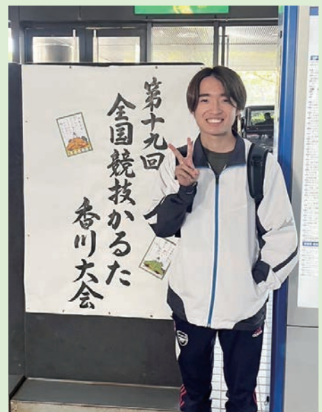
全国競技かるた香川大会

から楽しめています。 8月、大学に入ってから初の大会となる益田大会に出場しました。大会ならではの緊張感や、高揚感を2年ぶりに思い出したのを覚えています。優勝するという強気の目標を立てて臨んだ試合でしたが、結果は優勝。決勝以外は大差で勝ち切れたため、気持ちよくC級に昇段出来ました。9月には大学選手権の個人戦に出場しましたが、1回戦で敗退という非常に不甲斐ない結果となってしまいました。2回生でリベンジ出来たらと思います。そして10月、香川大会に出場しました。