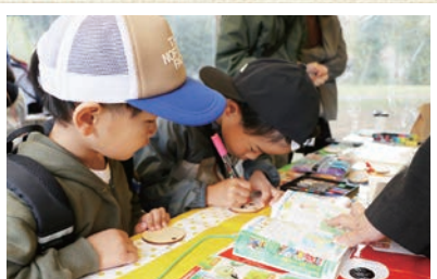
吉備青少年自然の家による出店