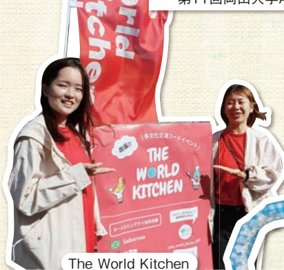
The World Kitchen