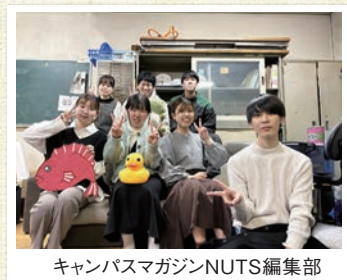
キャンパスマガジンNUTS編集部