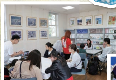
The World Kitchenワークショップ