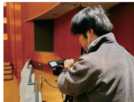
撮影業務を行っている様子

した。私たちの仕事で感謝の声を頂けるとがとても励みになっています。うまくいかないこともあります。その度に部員が成長し、次につながる事ができています。 このように大きな仕事を任せていただけたり、自由に作品を制作したりできるのは、応援してくださる皆様や、OH Bを信頼ある組織にしてくださった先輩方のおかげです。その感謝を忘れず、これからも自分たちが満足し、それを見た皆様も満足頂けるよう精進していきます。私たちの作品はOH B公式YouTubeよりご覧いただけます。今後ともOH Bをよろしくお願いたします。