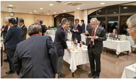
工学部同窓会 懇親会

月21日(土)に共育共創コモンズで開催しました(写真上)。懇親会は新型コロナナにより中止していましたが、4年ぶりに学内施設のピーチユニオンで開催しました(写真下)。