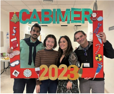
スペインセビリアの研究施設3ヶ月間の留学

短期間で得られた結果は限られており、次々と溢れる疑問を解決する時間はありませんでしたが、実験を重ねながら考察し仮説を調節していくという流れの中で、多くの可能性の中から研究の方向を探っていくという姿勢を学びました。