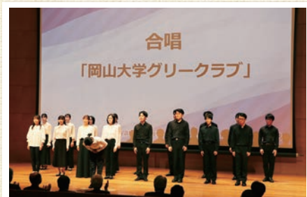
オープニングセレモニー(岡山大学グリークラブ)