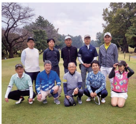
東京支部ゴルフコンペの様子

アラムナイ東京支部は、年に4回の懇談会、年2回のゴルフコンペ。年に1回の総会が基本行事となっております。毎回参加の方からのショートスピーチがあり学部を超えた楽しさがございます。写真は3ヶ月に1度の懇談会、ゴルフ、総会の写真です。毎年7月の東京支部総会、今年2024年は、7月21日(日)13時より、表参道のアニヴェルセル表参道でございます。コロナも終わり、久しぶりに多数の参加者で盛り上がりたく存