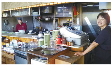
学生時代によく通った「アトミック・カフェ」。店の雰囲気もメニューも昔のまま

デジタル時代の中で 激変する新聞を目の当たりに。 変わるもの、変えないもの を見極めていきたい