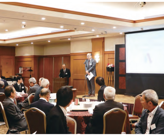
広島支部平成30年度総会会場の様子

広島県は、平成30年7月の豪雨災害で大きな被害を受けました。一方で、広島カープの3連覇ではとても盛り上がり、元気を回復した感じです。岡山大学にとって、広島県は隣の県で気候風土は似通っていますし、たくさん卒業生がいる県です。少しでも、広島県在住の岡山大学卒業生が懇親を深める機会を作ればよいと考えています。