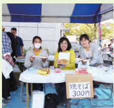
グッドジョブ支援センターによる模擬店

また、創立五十周年記念館周辺の屋外では、国立吉備青少年自然の家によるクラフトブース、同窓生・在学生・留学生らによる模擬店のテントが立ち並び、アパレルメーカー・ストライプインターナショナル協力のもと「岡山大学ストアイプマルシェ」も開催されるなど、多彩な催しが用意され、会場は多くの来場者で賑わいを見せていました。 この他にも、Jテラスカフェでの俳句の会、ピーチユニオンを利用したウェルカムパーティー等が開催された他、各学部では同窓生による講演会等が盛んに実施され、在校生と同窓生をつなぐ場として、活発な交流が行われていました。 今回のホームカミングデイでも様々な企画をご用意して皆様のご来場をお待ちしております。