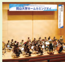
ミュージックフェスティバル