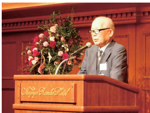
尾原Alumni東海支部代表幹事

平成30年9月30日(日)岡山大学Alumni(全学同窓会)東海支部設立総会・懇親会を、名古屋観光ホテルで開催しました。