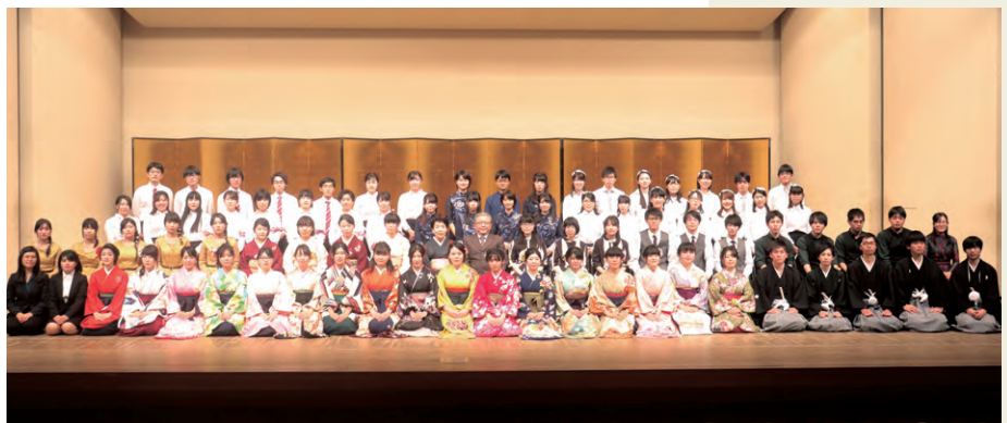
約80名が在籍する邦楽部

音を出すことさえも難しく、「首振り三年ころ八年」と言われるほどです。尺八はアンサンブルの中でメロディーを担うことが多く、多くの曲の中で重宝されています。 こうした日本の伝統的な楽器や邦楽の魅力を伝えるべく、これからも精進してまいりたいと思います。今後とも邦楽部をよろしくお願いいたします。