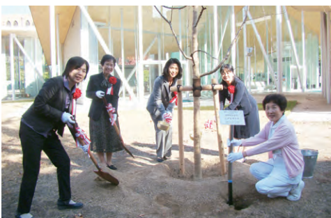
2018年11月21日、記念植樹が行われました

平成30年は、岡山大学医学部保健学科開設20周年・大学院保健学研究科開設15周年を迎えました。鹿田の地に看護の優しさが根付きますよう祈念いたします。