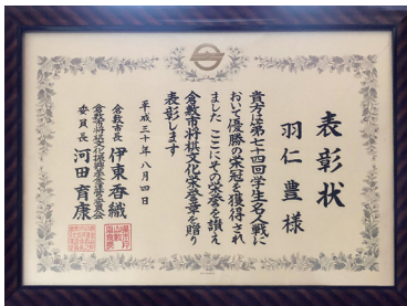
学生名人戦優勝により、2018年8月に倉敷市から「倉敷市将棋文化栄誉章」を贈られた