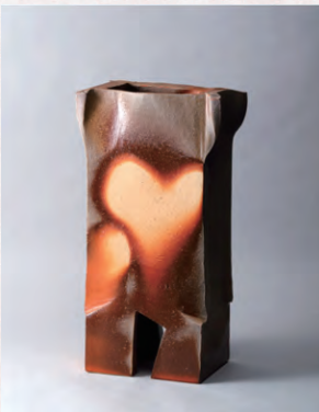
備前角花生(2008年) 岡山県立美術館蔵