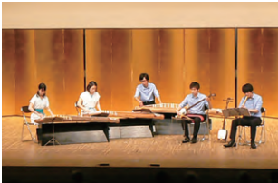
小編成による演奏

こんにちは。私たちは、岡山大学邦楽部です。よく「法学部」と間違われてしまう「邦楽部」ですが、実際の活動としては、箏・三味線・尺八をメインとした和楽器の演奏を行っています。年2回開催する演奏会や他大学との交流イベントに向け、日々鍛錬しています。 部員につきましては、各学年25人前後おり、全体としては80名近い大所帯で活動をしています。大学に入ってから邦楽を始めた者が8割以上ではありますが、語りつくすことのない邦楽の奥深さに魅了され、各々が求める音色を追究していきます。 さて、私たちは、古典的な音楽だけでなく、第二次大戦後に伝統音楽と西洋のクラシック音楽の融合により生まれた「現代邦楽」という比較的新しいスタイルの音楽を演奏しています。