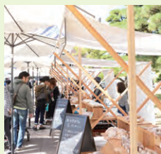
ストライプマルシェ