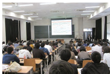
OBによる企業等経験講演会

平成30年度は、会報の全面カラー化を行い、紙面を一新しました。また、ホームページも全面改訂しています。是非とも内容をご確認ください。