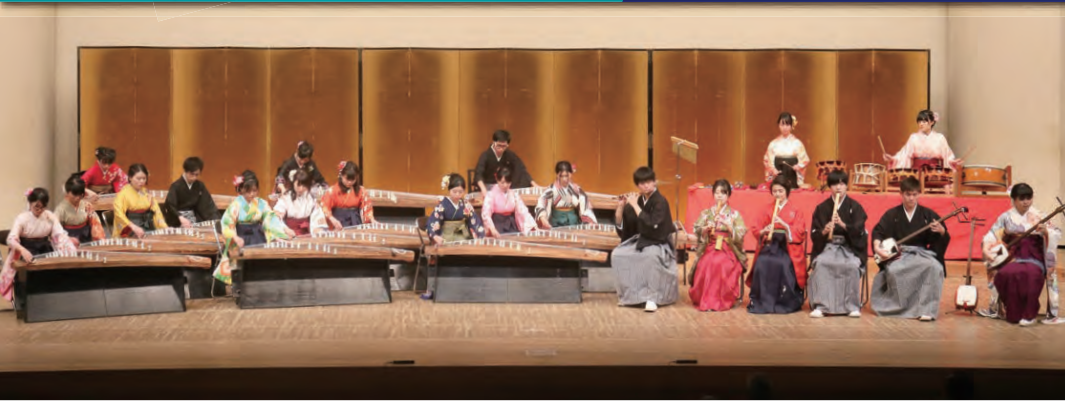
3年生による大合奏

こんにちは。私たちは、岡山大学邦楽部です。よく「法学部」と間違われてしまう「邦楽部」ですが、実際の活動としては、箏・三味線・尺八をメインとした和楽器の演奏を行っています。年2回開催する演奏会や他大学との交流イベントに向け、日々鍛錬しています。 部員につきましては、各学年25人前後おり、全体としては80名近い大所帯で活動をしています。大学に入ってから邦楽を始めた者が8割以上ではありますが、語りつくすことのない邦楽の奥深さに魅了され、各々が求める音色を追究していきます。 さて、私たちは、古典的な音楽だけでなく、第二次大戦後に伝統音楽と西洋のクラシック音楽の融合により生まれた「現代邦楽」という比較的新しいスタイルの音楽を演奏しています。