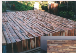
首相官邸の陶壁 (2001年)