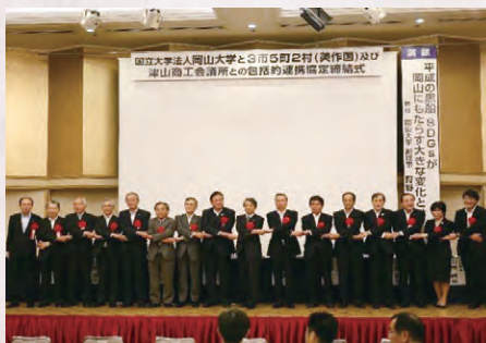
作州地域の10市町村および津山商工会議所と包括的連携・協力に関する協定を締結