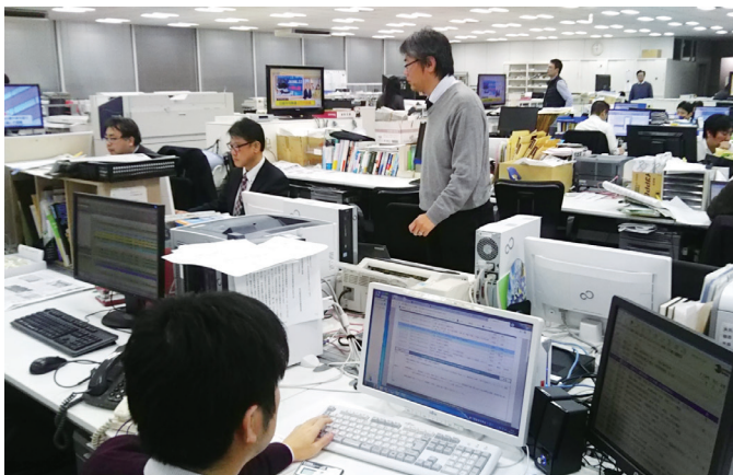
山陽新聞メディア報道部がある本社編集局フロア

を目の当たりにしてきました。入社当時は手書きで記事を執筆する先輩がいましたし、新聞写真はほとんどがモノクロ。時代とともにワープロ、パソコンに切り替わり、カメラはデジタルに。最近の私は、かさばるカメラを持ち歩かず、もっぱらスマホで撮影しています。最大の変化は多メディア化でしょう。ネットニュースが当たり前のものとなり、いつでも、どこでも情報を得られるスマホが普及。新聞各社はデジタル対応に力を入れ、弊社でも電子版「山陽新聞デジタル（さんデジ）」を展開し、Yahoo!、LINEといったネットメディアに記事を提供しています。その最前線を任されているのが、現在所属しているメディア本部です。膨大なデータを受け止め、随時編集可能なデジタル分野には大きな可能性がある一方、情報が大量供給・消費されているとも感じます。そんなデジタル化のうねりの中で、われわれの使命を再認識させられた出来事がありました。西日本豪雨の被害が報告され始めた昨年7月6日深夜、報道部デスクとして記事を取りまとめたところ、岡山市の本社ビルで地震のような揺れを感じました。約20km離れた総社市のアルミ工場が爆発したのです。豪雨に起因した事故でしたが、その時は何が起きたのかわからず、断片的な情報を手掛かりに記者を派遣。電話で報告を受け、約40分後に速報