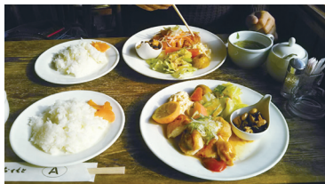
アトミック・カフェのランチ

岡山大学を卒業し、山陽新聞社の記者として歩んで30年近くになります。この間、新聞業界の激変