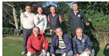
2018年岡山大学Alumni愛媛県支部ゴルフコンペ