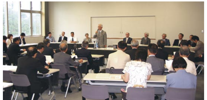
平成22年度同窓会総会風景

平成23年度の岡山大学同窓会役員会・総会の開催は、岡山大学開学記念日の10月22日(土)に開催いたします。詳細については、改めて岡山大学ホームページ等でお知らせいたします。