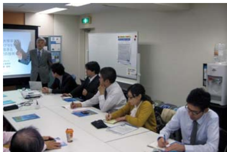
前回のセミナーの様子

Alumni 東京支部は、今年度3回目となる卒業生フォローアップセミナーを開催します。