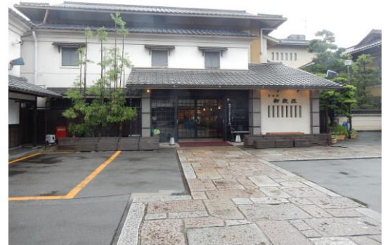
総会・懇親会会場 聖護院御殿荘